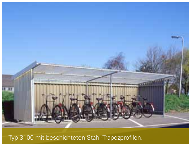
Typ 3100 mit beschichteten Stahl-Trapezprofilen.