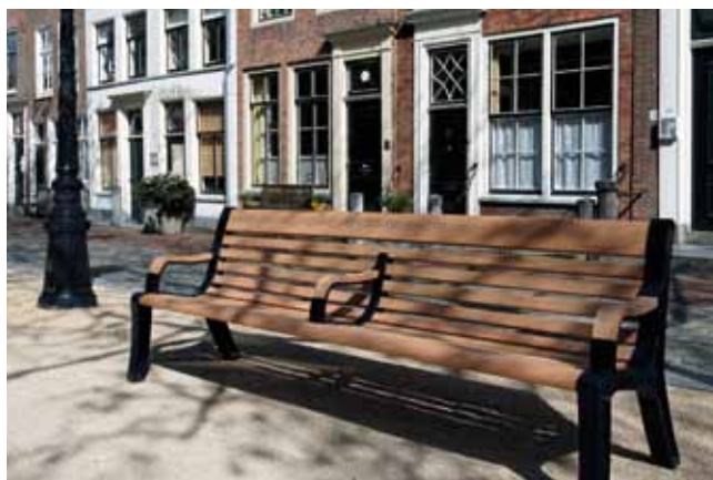
Bank 240 cm mit 3 Armlehnen