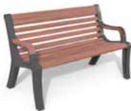
Grace 140 A