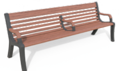
Grace 240 A