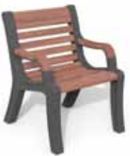
Grace 64 A