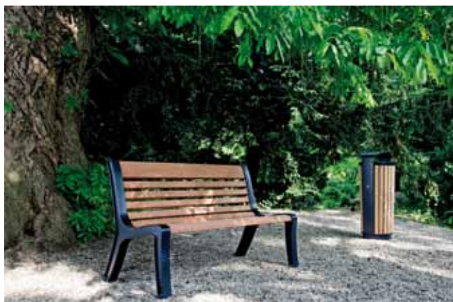
Bank 180 cm