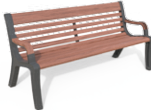
Grace 180 A